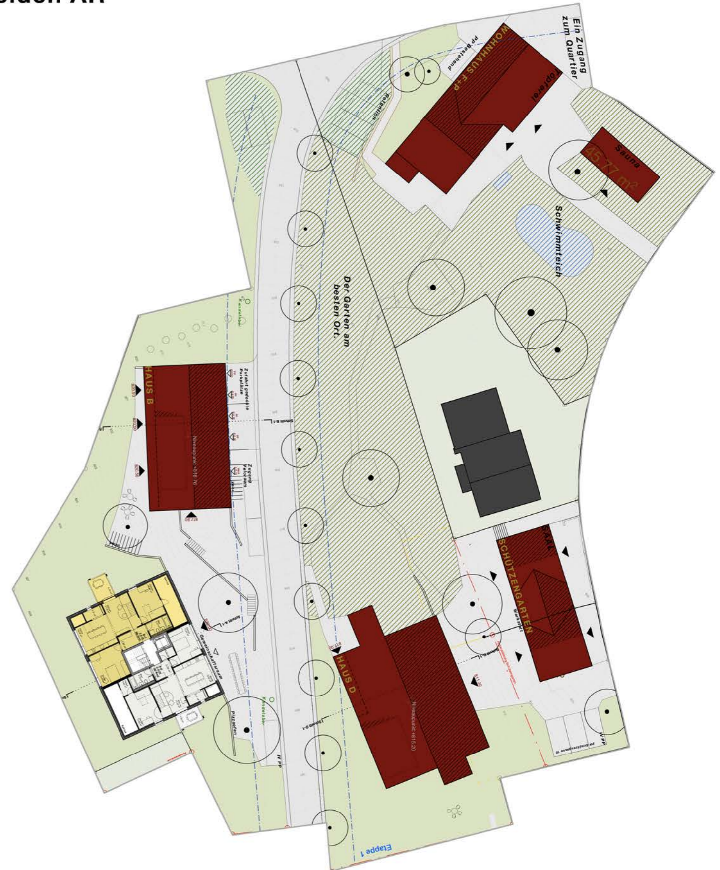
Übersichtsplan MST 1:500